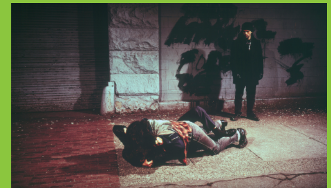
Jeff Wall, Fight on the Sidewalk, 1994