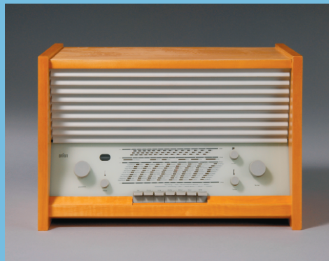
Hans Gugelot, Radio G11-Super, 1955, Hersteller: Braun AG, Frankfurt/M. Besitz: Die Neue Sammlung – Staatliches Museum für angewandte Kunst | Design in der Pinakothek der Moderne, München

Du wirfst einen Blick hinter die Kulissen des Museumsbetriebs und sprichst mit Menschen, die in verschiedenen Museumsbereichen arbeiten.