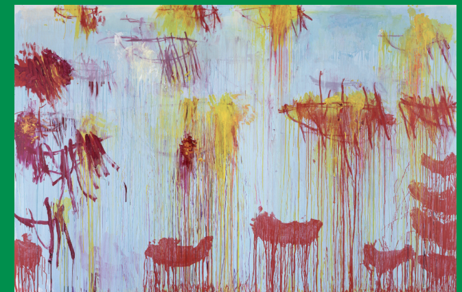
Cy Twombly, Lepanto XI, 2001, Museum Brandhorst © Cy Twombly. Foto: Haydar Koyupinar

Seminar-Termine: 14.–19.02.2012 und 31.07.–05.08.2012. Anmeldeschluss: Freitag, 25.11.2011 (Seminar 1), bzw. Freitag, 25.05.2012 (Seminar 2).