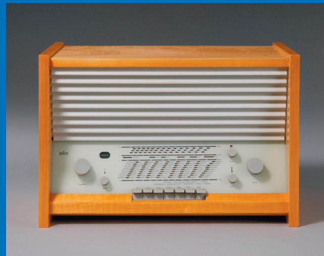
Hans Gugelot, Radio G11-Super, 1955, Hersteller: Braun AG, Frankfurt/M. Die Neue Sammlung – The International Design Museum Munich.

Du wirfst einen Blick hinter die Kulissen des Museumsbetriebs und sprichst mit Menschen, die in verschiedenen Museumsbereichen arbeiten.