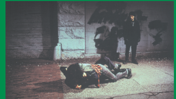
Jeff Wall, Fight on the Sidewalk, 1994, Sammlung Moderne Kunst, Pinakothek der Moderne Courtesy